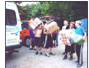
Sommer 2003- Straßenkinder aus Kruglowo erleben Ferien in Falkenstein