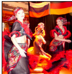
Kieler Woche Abend 2004. „K-System“ aus Kiel und russische Folklore von „Metschta“ aus Kaliningrad